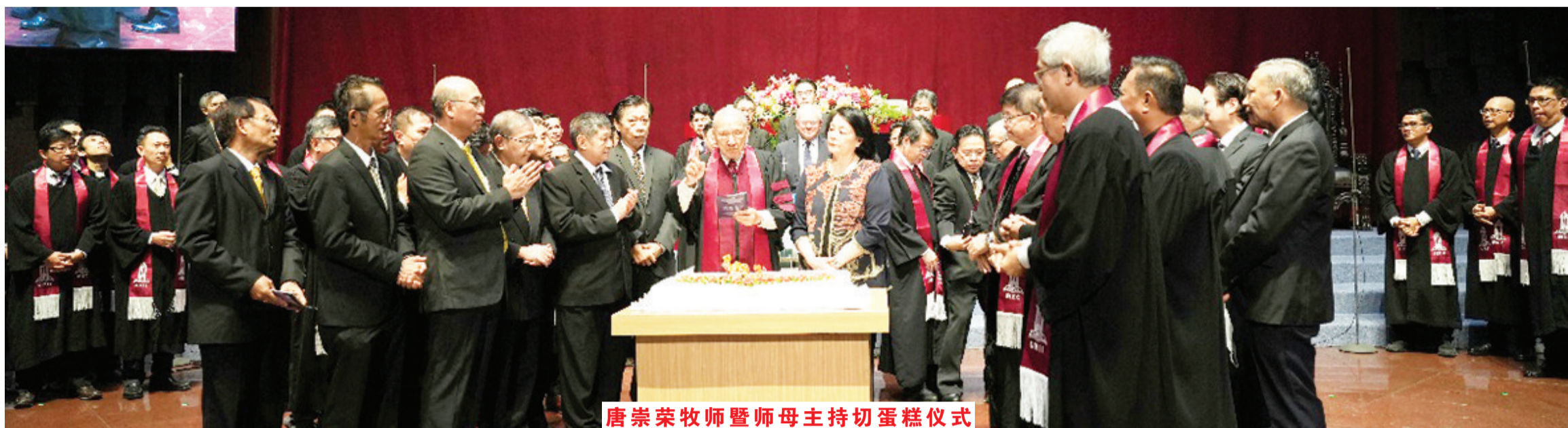
唐崇荣牧师暨师母主持切蛋糕仪式